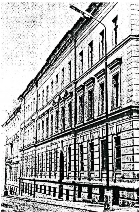
1. Križkova 7, Bratislava

krídiel bude predmetom III. a IV. etapy rekonštrukcie. S definitívnym ukončením stavebných prác sa počíta v roku 1999 a v horizonte prelomu tohto storočia so začatím rekonštrukcie a modernizácie centrály archívu v Bratislave.